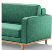
NLP noga drewniana w kolorystyce N