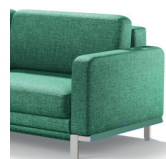
CR noga metalowa