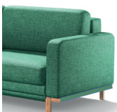
N noga drewniana w kolorystyce N